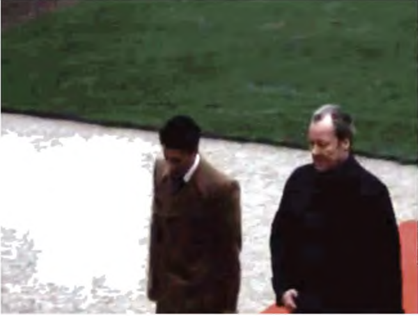
أثناء استقبال عبد السلام جلود في ألمانيا الغربية، وجانب من لقاءه المستشار الألماني ويلي براندت، 27 / 2 / 1974.